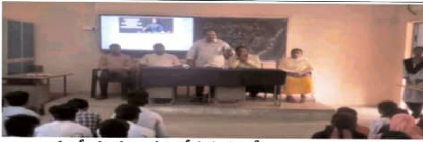
అంతర్జాతీయ గణాంక దినోత్సవ సభలో ప్రసంగిస్తున్న ప్రిన్సిపాల్